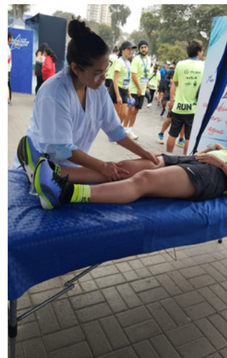
MARATÓN LIMA 2023