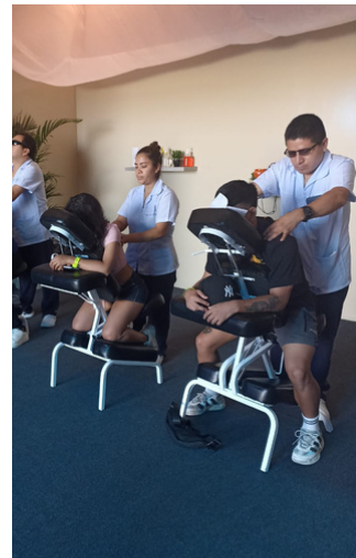
EVENTO ELECTRÓNICO UNMSM